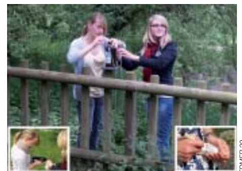
Surveillance des eaux des rivières par les élèves de Lesneven