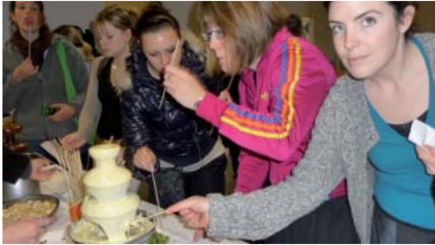
Regards avides et gestes gloutons...

«Prenez des bananes, des oranges, des pommes et des kiwis, épluchez-les et découpez-les en morceaux. Faites-en des brochettes co-