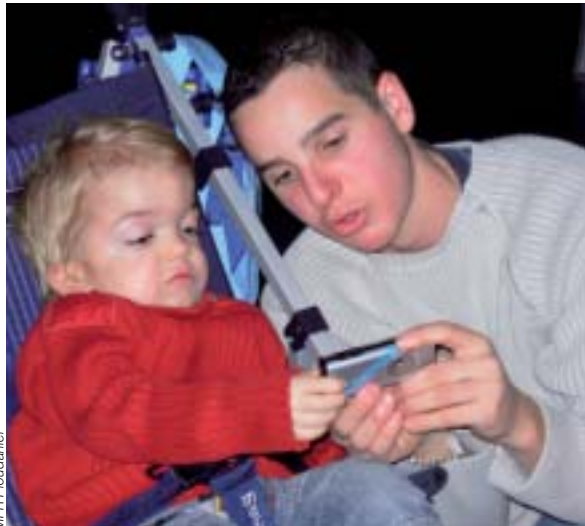
Deux regards pour un même objectif