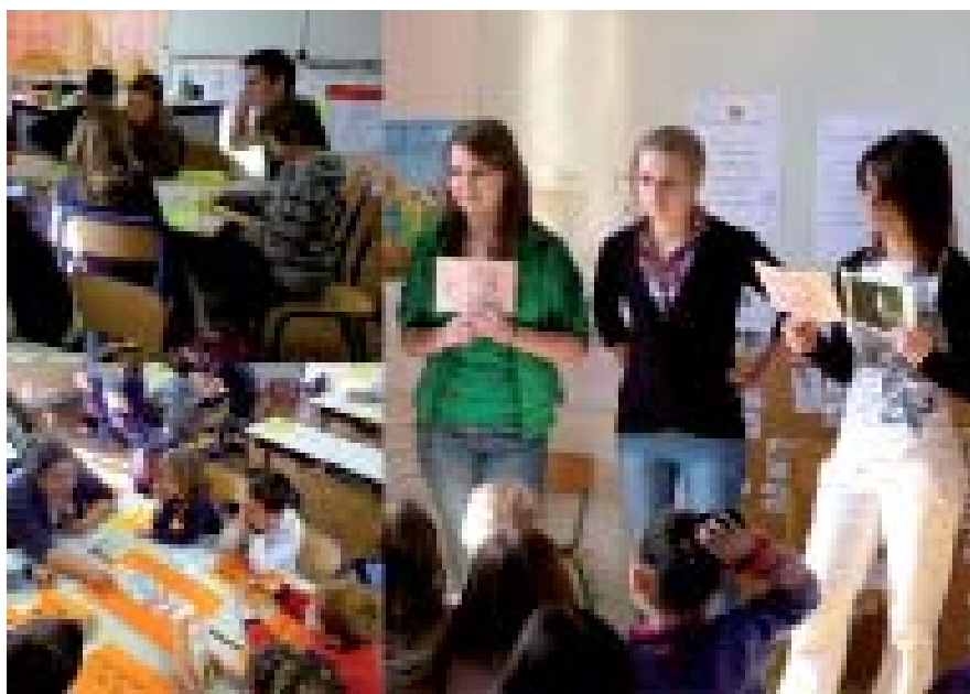
Les élèves animent leurs ateliers santé auprès des enfants

concerné les composantes suivantes: l'hygiène corporelle, les habitudes alimentaires sur une journée, la place du sommeil et