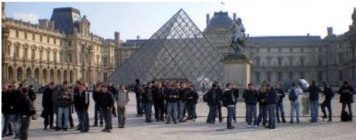
Les élèves devant la pyramide du Louvre.

Tous les deux ans, les élèves de la maison familiale et rurale d'Elliant se rendent au salon international de la machine agricole (SIMA) à Villepinte. Cette année, ce sont les classes de CAPA PAUM et de seconde agroécologiquement qui ont effectué en