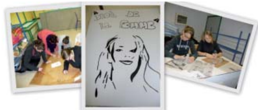
Quelques unes des productions réalisées lors des ateliers.