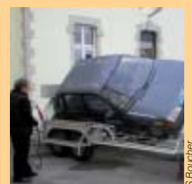
Démonstration de tonneau