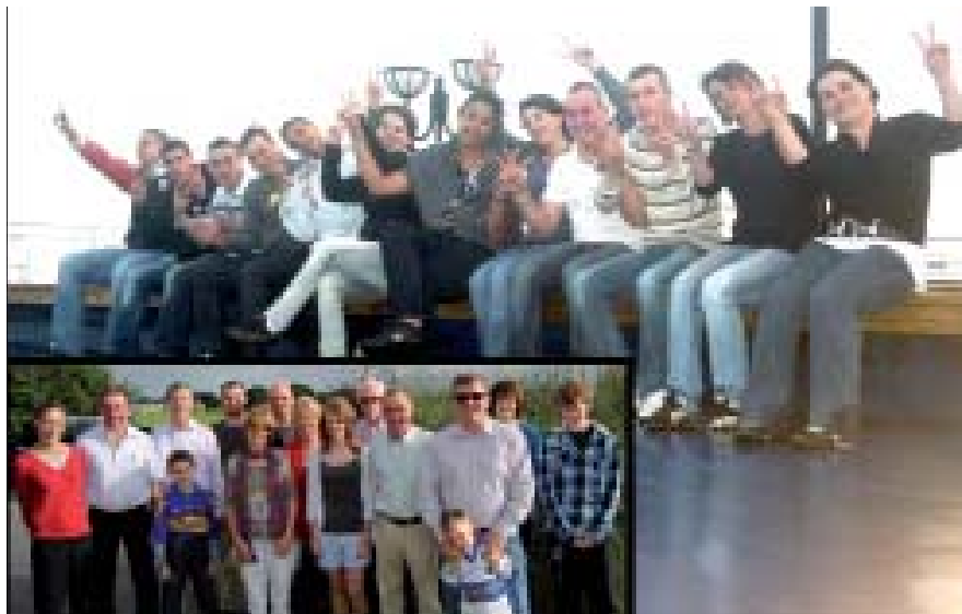
En haut : les élèves de première de l'année passée sur le pont du ferry «Norman Voyager». Encadré : venue de leurs maîtres de stage irlandais à la MFR pour le Space en octobre 2010.