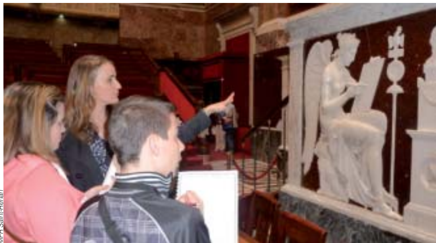
Les élèves attentifs aux explications du guide.

Tous les 2 ans est organisé un voyage d'étude pour les élèves de 4 e et 3 e . Ils sont allés du 18 au 22 avril à la découverte de la capitale.