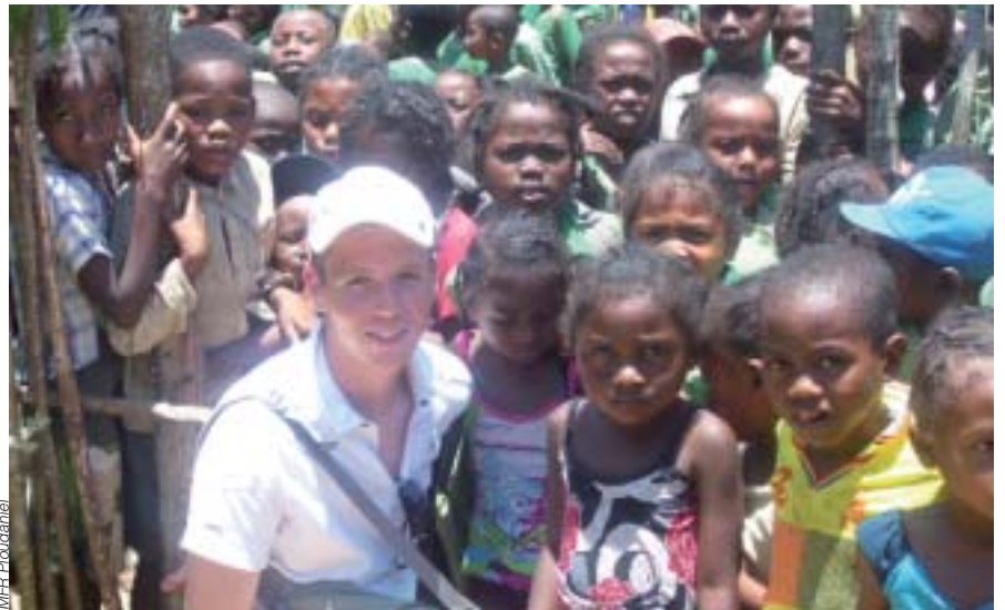
De Ploudaniel à Madagascar

Initiée par la MFR, son équipe pédagogique et ses élèves, avec le soutien de la municipalité de Ploudaniel, « La Fête des Terroirs d'ici et d'Ailleurs – Forum de Ploudaniel » a tenu sa 21 e édition en mai dernier. Deux cents exposants et quatre cents bénévoles étaient à pied d'œuvre. La singularité de cette fête rurale tient à ses concepts : gratuité, convivialité, réflexion et animation. À l'origine très agricole, le Forum a évolué pour s'enrichir de la gastronomie des Terroirs de France, d'un village international puis d'un espace destiné à la littérature.