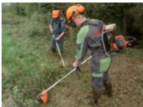
Les MFR impliquées dans leur territoire