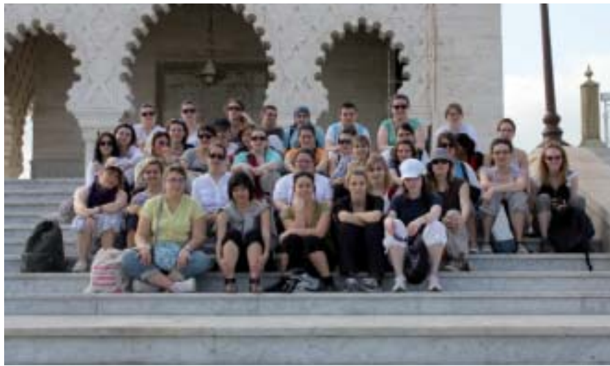
Le groupe de Bac Pro 2 devant le mausolée Hassan II.

Durant les stages c'est un véritable échange qui est mis en place. Nos jeunes découvrent une autre façon de travailler, d'aborder le lien social avec le filtre de la culture marocaine. Mais c'est aussi le personnel des entreprises dans lesquelles sont nos élèves, qui va pouvoir comparer ses méthodes de travail avec celles apprises par nos jeunes en France. Il s'agit bien d'un enrichissement mutuel.