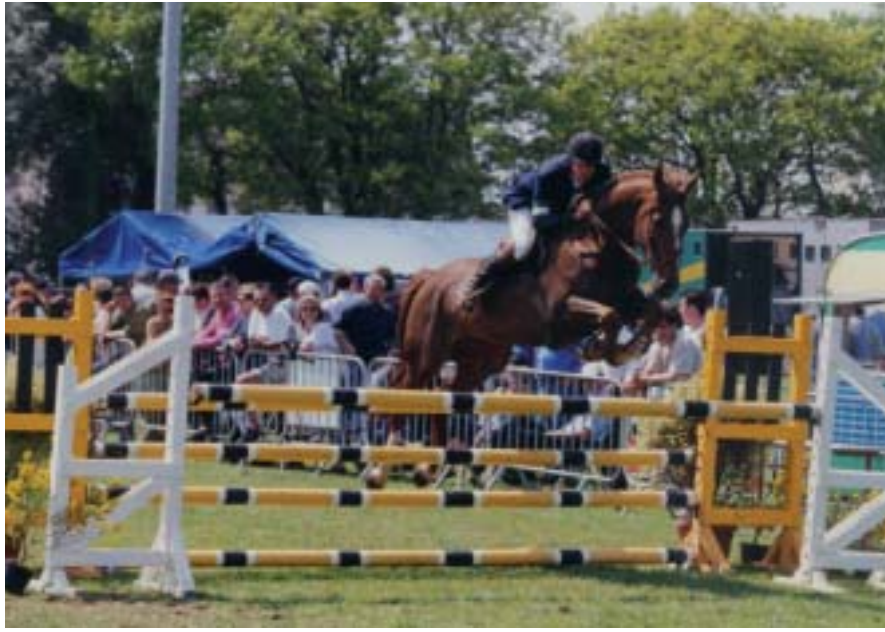
Le concours hippique organisé par les élèves

élèves s'est rendue au centre équestre de Plabennec pour la préparation de la piste d'obstacles et la mise en place des