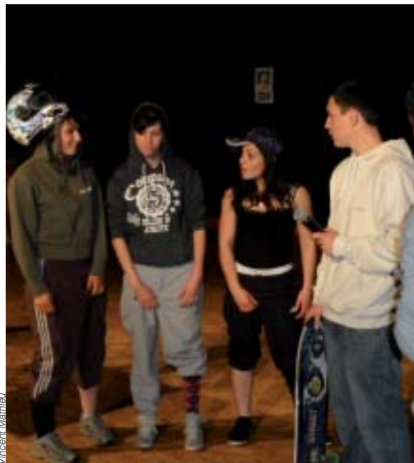
Les élèves en pleine répétition.

Puis c'est le grand jour : nous voici à Ploudaniel, devant 250 personnes, le trac monte... Nos formateurs nous réconfortent et nous donnent les dernières consignes. C'est les trois coups, nous voilà sur scène, devant les projecteurs. Chacun donne le meilleur de lui-même, le public réagit aux notes d'humour de notre texte et à notre jeu. C'est la fin, les applaudissements crépitent ! Nous sommes heureux, quelle expérience ! Qui aurait cru que nous ferions du théâtre dans notre formation ?