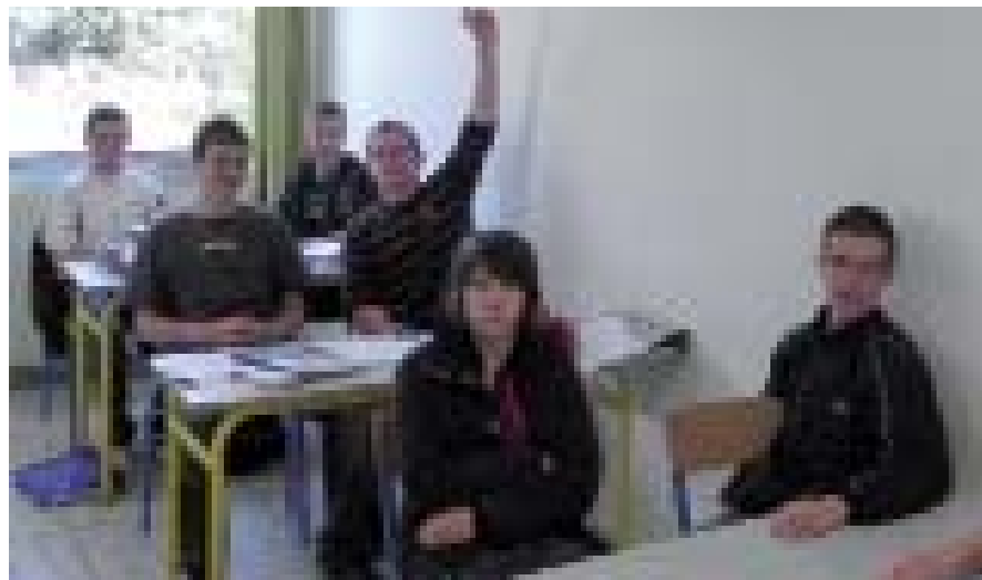
Intervention de la Brigade de prévention de la délinquance juvénile