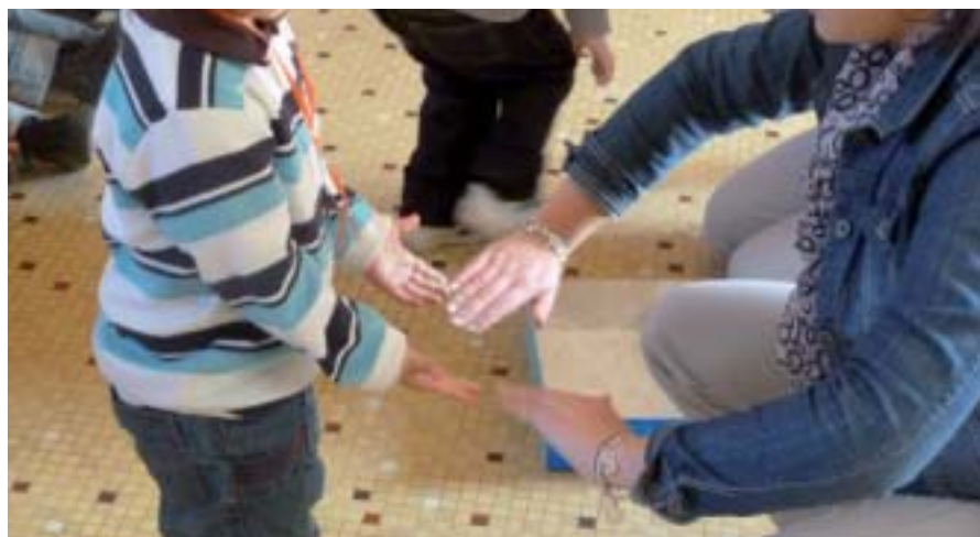
Sensibilisation à la transmission des microbes