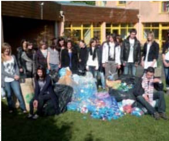
La classe de seconde à l'issue de la collecte de bouchons

Afin de financer l'action de l'association Handichiens, les élèves de la MFR, aidés des habitants de Landivisiau et des communes alentours, collectent des bouchons en plastique. Ceux-ci sont ensuite vendus au poids puis fondus pour fabriquer des palettes.