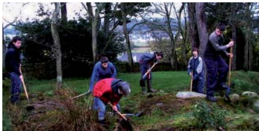
Les 4 e de l'Iréo préparent le jardin des plantes anticancéreuses de Roscoff

Saint-Pol-de-Léon, jeudi 24 février, 9h du matin. Les 4 e techno de l'Iréo de Lesneven sont à pied d'œuvre pour débroussailler une zone de rochers sur laquelle sera aménagée une cascade. Elle recevra des plantes de zone humide et des plantes parfumées. Ils travaillent pour l'Association JPAC (Jardin de Plantes Anticancéreuses).