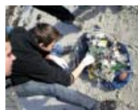
Nettoyage de la plage de Beg Meil.

autres débris ont été déposés en haut des dunes et récupérés par les services techniques de la voirie. De retour en classe, une étude du cycle de l'eau a démontré la dangerosité du dépôt d'ordures dans la nature ; et chacun a réfléchi et proposé des solutions adaptées. Un premier pas vers l'éco-citoyenneté.