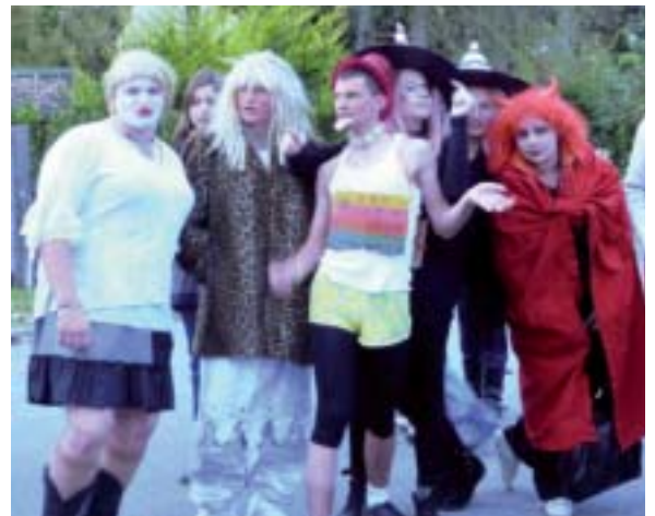
Test des déguisements pour les futurs acteurs.

Inspiré par l'équipe pédagogique, puis imaginé par les élèves de la Maison Familiale de Poullan-sur-Mer, l'idée d'un lip dub (clip promo réalisé par des collègues et diffusé sur des réseaux sociaux) se préparait depuis quelques mois. La rumeur courait qu'un clip en chanson allait être réalisé dans nos couloirs. Une chorégraphie humoristique, des bras qui se lèvent et c'était parti pour le grand show « made in Poullan »!