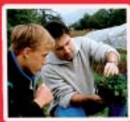
Horticulture, Paysage Fleuriste www.mfr-plabennec-ploudaniel.fr