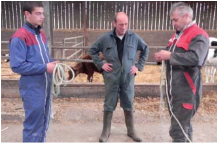
Le stage est idéal pour échanger régulièrement sur les pratiques

Ainsi, pour eux, «il n'y a pas de gros décalage entre l'école et le stage» , «quand le jeune arrive sur le marché du tra-