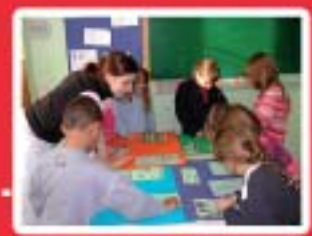
Services aux Personnes www.mfr-plounevez.com