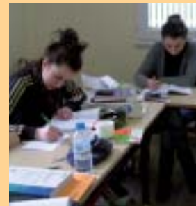
Les petits groupes facilitent le travail

Depuis une dizaine d'années, la MFR prépare aux concours d'entrée aux écoles sociales et d'infirmiers. Cette formation a été ouverte pour répondre aux besoins des personnes qui ont du mal à se préparer seules. Elle est accessible aux titulaires du Baccalauréat pour les concours d'infirmier, d'éducateur spécialisé, d'assistant de service social ou d'éducateur de jeunes enfants. Elle se déroule de fin septembre à début mars à raison de deux jours et demi par semaine, soit 300 heures de cours en tout. Un réel investissement dans le travail personnel est nécessaire. L'association de profession-