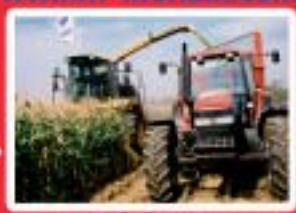
Agriculture Services aux Personnes www.mfr-pleyben.com