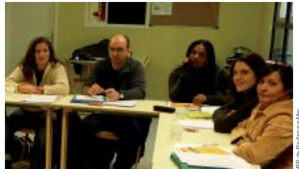
Un groupe de stagiaires en «technique d'entretien».

Cap Sizun, pays de Douarnenez, pays de Quimper, notre territoire se transforme et vieillit. Comment y développer des activités de manière à trouver un travail sur place ?