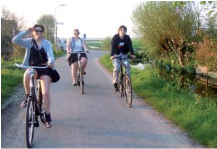
À vélo, le long des canaux à Boskoop.

Des «voyages d'étude» en Angleterre ont déjà été organisés, mais leur durée était trop courte pour qu'ils constituent de véritables «bains linguistiques». L'expérience de la langue ne sera prégnante que si elle entretient un lien étroit avec l'orientation professionnelle. D'autant que le Conseil régional fait campagne auprès des établissements scolaires, pour faire connaître ses dispositifs en faveur de la mobilité des jeunes – les bourses Télémaque notamment – et il s'agit de les mettre à profit. Chaque année, en avril/mai, les élèves de 1 re effectuaient un stage d'un mois hors région : celui-ci se déroulerait désormais à l'étranger. Mais où? Les Pays-Bas, première plate-forme européenne de