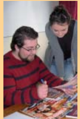
Se tenir informé, cela s'apprend

Depuis deux ans, la MFR met en place une préparation à l'oral pour les concours d'entrée aux écoles d'auxiliaire de puériculture et d'aide soignant. Cette formation est ouverte aux personnes de plus de 17 ans, aucun diplôme n'est requis pour se présenter. L'inscription se fait sur dossier et entretien. La formation se déroule sur un jour à un jour et demi par semaine, de septembre à février, soit 120 heures de formation pour les aides soignantes et 171 heures pour les auxiliaires de puériculture et fait appel à de nombreux professionnels. Les stages sont possibles durant la formation. Les stagiaires peuvent se restaurer à la MFR