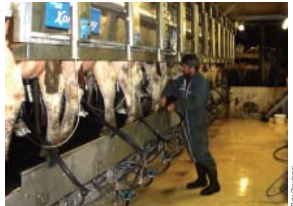
Essentiel maître de stage.

Le stage est l'un des fondamentaux du cursus par alternance de nos jeunes. Le maître de stage est un pilier. C'est particulièrement vrai pour les jeunes engagés en Bac Pro. Les études réalisées en collaboration avec l'élève englobent aussi bien des aspects techniques, une approche environnementale, les notions de sécurité, de prévention, de sécurité alimentaire, d'option économique et financière pour au final dégager la cohérence d'un système.