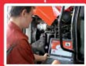
Mécanique, Agroéquipement www.mfr-elliant.com