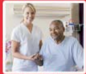
Services aux Personnes www.mfr-strenan.com