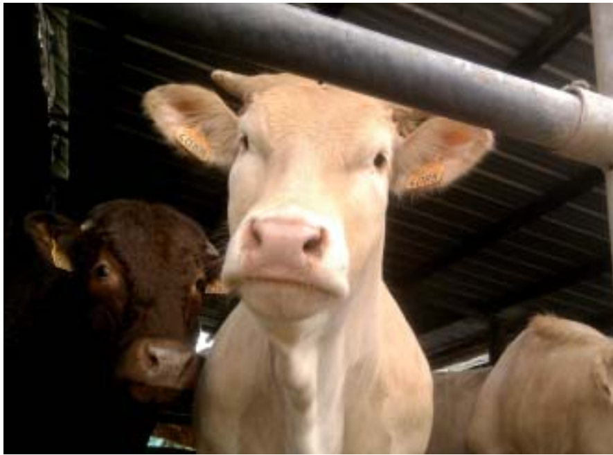
Stage en exploitation laitière

Ce stage a pu aussi être, pour certains, une totale découverte et l'occasion de passer outre ses préjugés comme pour Cédric Le Gac : « Je n'aimais