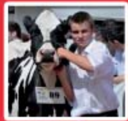
Agriculture Alimentation, Hygiène www.mfr-plabennec-ploudaniel.fr