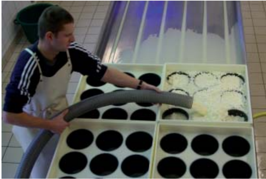
Fabrication de fromage en Haute-Savoie.

La moitié des élèves a saisi cette opportunité pour découvrir les richesses de fermes françaises hors de Bretagne. Des jeunes ont ainsi été initiés aux productions fromagères alpines, à l'élaboration du champagne dans la Marne ou encore au savoir-faire relatif au foie gras dans le Sud-Ouest. L'authenticité et la singularité se sont naturellement déclinées lors ces expériences en relation directe avec les consommateurs. Les placements en stage, assurés par la Maison familiale, ont été simplifiés grâce aux relations tissées dans le cadre du forum depuis de nombreuses années. Les élèves restés dans le