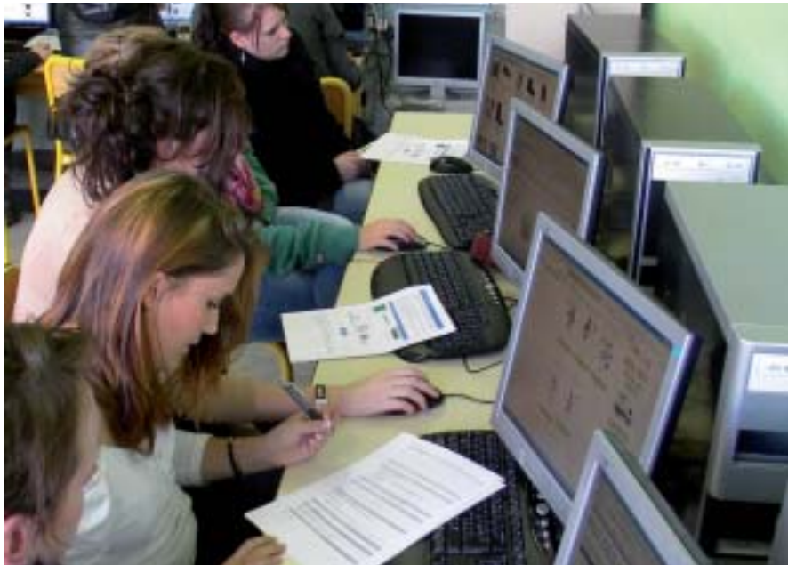
Création d'une E-boutique par la classe de Terminale Bac Pro.