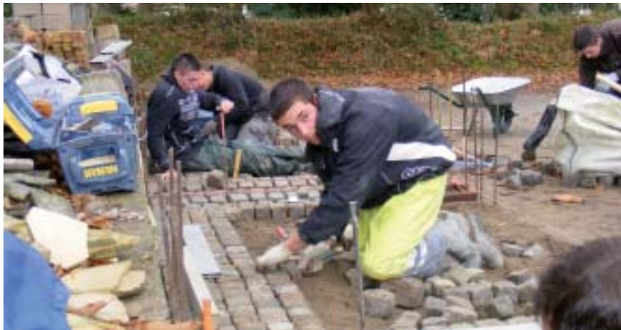
La pose de pavés : une technique de précision.