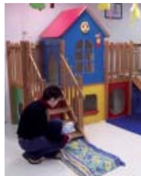
Le stage permet de mieux appréhender son environnement.

Les jeunes à l'issue de leur formation obtiennent un diplôme de niveau IV et peuvent être embauchés dans des collectivités, des organismes de services, des structures d'accueil. Ils peuvent également poursuivre les études en BTS, entrer en école professionnelle ou préparer des concours.