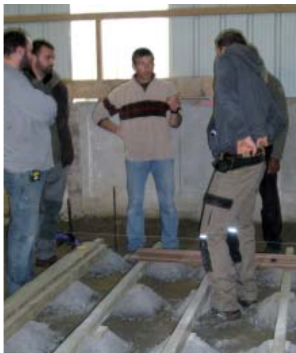
Perfectionnement «Terrasses bois» auprès des professionnels du paysage.

capacité à s'adapter à des situations nouvelles, compétitivité du salarié, reconnaissance de ses atouts et plus grande estime de soi. Il est très important aussi, en tant que formateur, de répondre à ces demandes formulées par les entreprises et les salariés, ainsi dans ce partenariat de proximité, les salariés font le choix de se former et les entreprises les incitent à valoriser leur parcours professionnel, passage indispensable dans l'évolution du monde du travail.