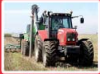
Agriculture, Horticulture Gestion Commerce www.lreo.org