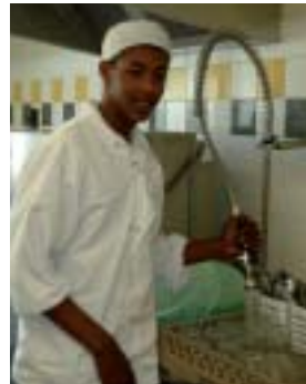
Tous les secteurs professionnels sont accessibles, ici la découverte de la restauration collective.