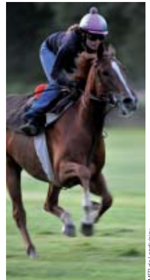
La découverte du milieu des courses.

de la MFR de Landivisiau ainsi qu'aux écoles extérieures. Des professionnels de la filière et des membres du conseil d'administration sont aussi invités.