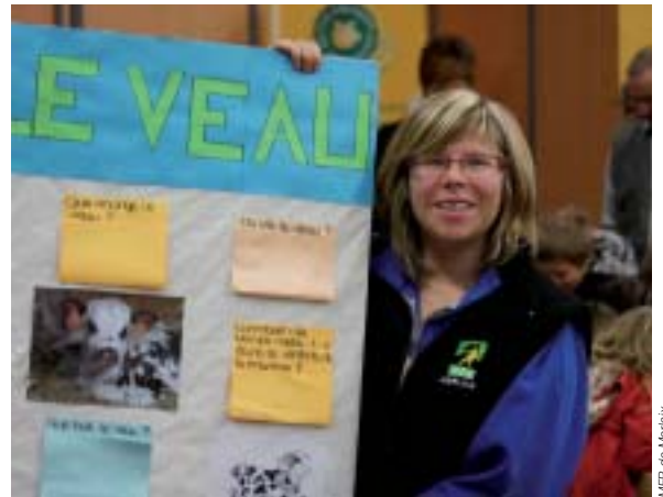
Les élèves assurent l'animation d'ateliers au festival de l'agriculture de Morlaix.

Accueillir régulièrement des enfants des écoles primaires de Morlaix communauté est devenu presque une routine pour les élèves de la Maison familiale. Cette opération «découverte de la ferme», proposée à l'ensemble des écoles, rencontre un réel succès auprès des institutrices. Tous les élèves de CP de Morlaix communauté sont donc invités tous les ans par l'organisation et Morlaix Communauté.