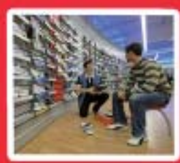
Vente, Commerce www.mfr-rumengol.com