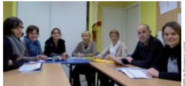
L'équipe pédagogique de la MFR de Plounevez-Lochrist.

Les services en milieu rural sont en pleine expansion, les statistiques prévoient la création de 300000 emplois dans les dix prochaines années. Dans ce contexte, tabler sur des métiers de services aux personnes peut s'avérer un pari gagnant pour pérenniser et sécuriser la carrière professionnelle de nos élèves.