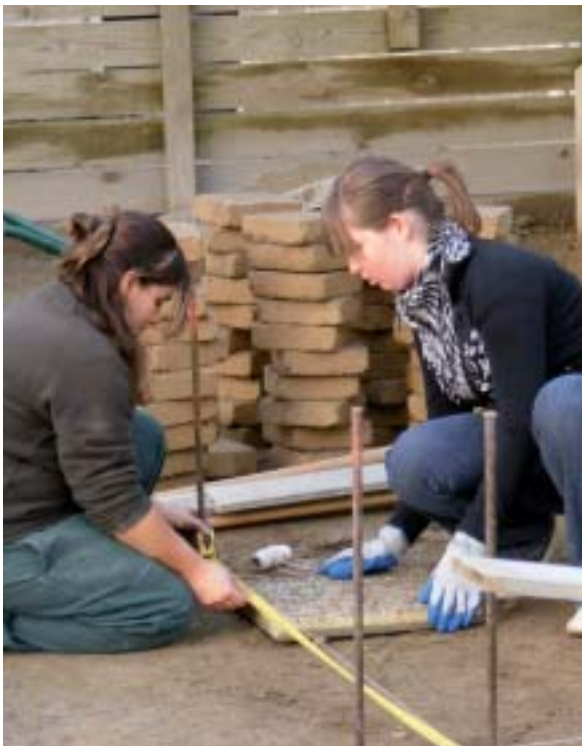
Une implication partagée.

La journée consolide ainsi les éléments en leur possession qui leur permettront d'arrêter une décision importante en fin d'année : celle de leur orientation. En outre, l'expérience atteste aussi de la nécessité de se former à tout âge. Les élèves intègrent l'idée qu'il est toujours nécessaire d'apprendre pour maîtriser les meilleurs procédés et rester, de ce fait, performants.