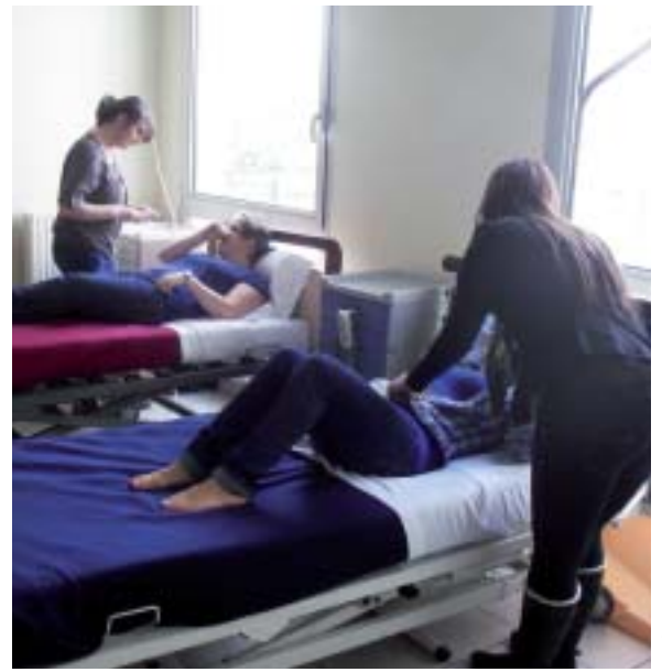
Pratiques professionnelles, un entraînement avant les stages.