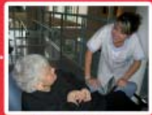
Agriculture Services aux Personnes www.mfr-morlaix.com