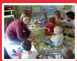
Services aux Personnes www.mfr-poullan.org