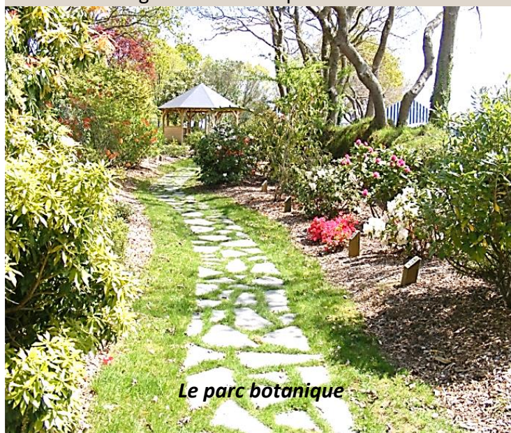
Le parc botanique

Cette formation par alternance permet d'obtenir un excellent taux de réussite aux examens et une très bonne intégration en entreprise